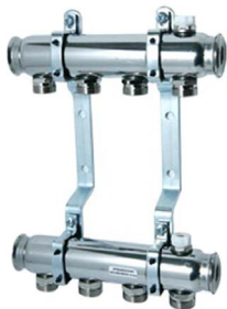
Rozdzielacz do C.O.