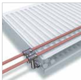
TP Suora 4