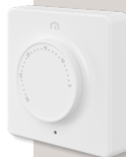
ELEKTRONICZNY TERMOSTAT Z POKRĘTŁEM UNISENZA DIAL