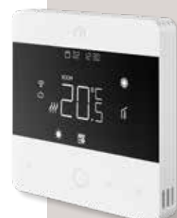
PROGRAMOWALNY TERMOSTAT UNISENZA WI-FI