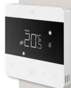
TERMOSTAT CYFROWY UNISENZA DIGITAL