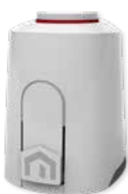
SIŁOWNIK TERMICZNY UNISENZA

Układ sterowania szybko reaguje na każdą zmianę i bez trudu dostosowuje się do aktualnego zapotrzebowania. Gwarantuje wydajne ogrzewanie i chłodzenie zapewniając optymalną temperaturę dla użytkownika w pomieszczeniach oraz minimalne zużycie energii. Idealnie wpisuje się to w wizję marki Purmo, producenta zrównoważonych rozwiązań z zakresu komfortu wewnątrz.