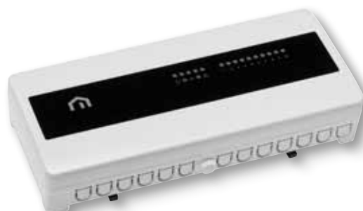
LISTWA AUTOMATYKI UNISENZA