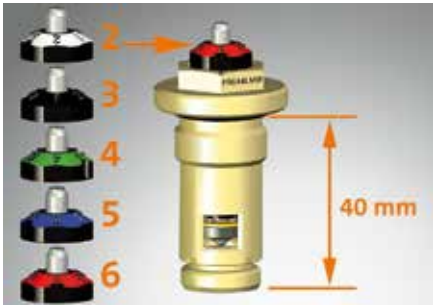
Purmo Ventilheizkörper werden seit 2011 sukzessive mit werkseitig voreingestellten Ventileinsätzen geliefert. Es gibt fünf verschiedene Ventile. Farbliche Markierungen zeigen an, mit welcher Voreinstellung das Ventil ausgeliefert wurde (Einstellwerte 2, 3, 4, 5 oder 6)