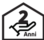
Garanzia su componenti elettrici