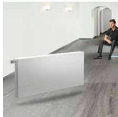
Horizontaler Dekorativheizkörper Faro H