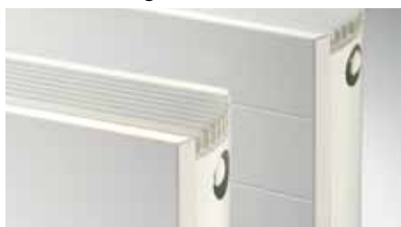
Mit ebener Frontfläche (Kos) oder feinprofiliert (Faro)