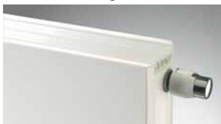
Leicht gebogene Seitenverkleidungen

Perfekte Verarbeitung und bis ins Detail durchdachte Lösungen