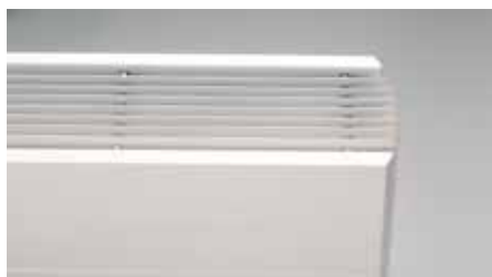
Elegante Ziergitter (Kos H/Faro H)