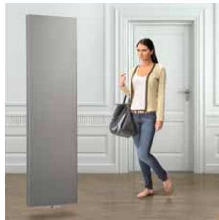
Vertikaler Dekorativheizkörper Kos V