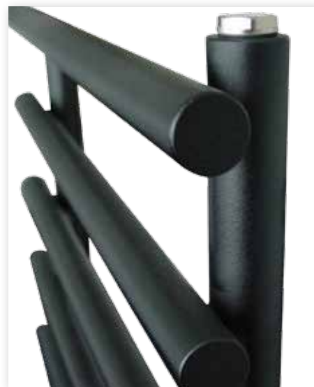
Die waagerechten Rohre scheinen vor den senkrechten Sammelrohren fast zu schweben. Eine besondere Wirkung erzielt die hier verwendete Sonderfarbe „Black Textured“ mit Struktureffekt.

Neben der Standardfarbe Weiß (RAL 9016) ist der Leros gegen Aufpreis auch in allen RAL-classic-Farben und vielen Sanitärfarben erhältlich. Eine ganz besondere Wirkung können Sie erzielen, wenn Sie sich für eine von Purmos „metallischen Farben“ entscheiden.