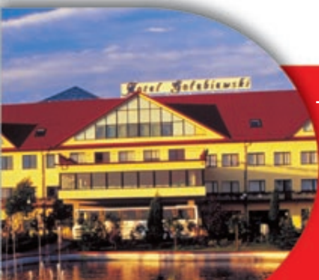
700 weekend w kraju