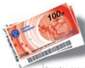
200 bon towarowy Sodexho 200 zł