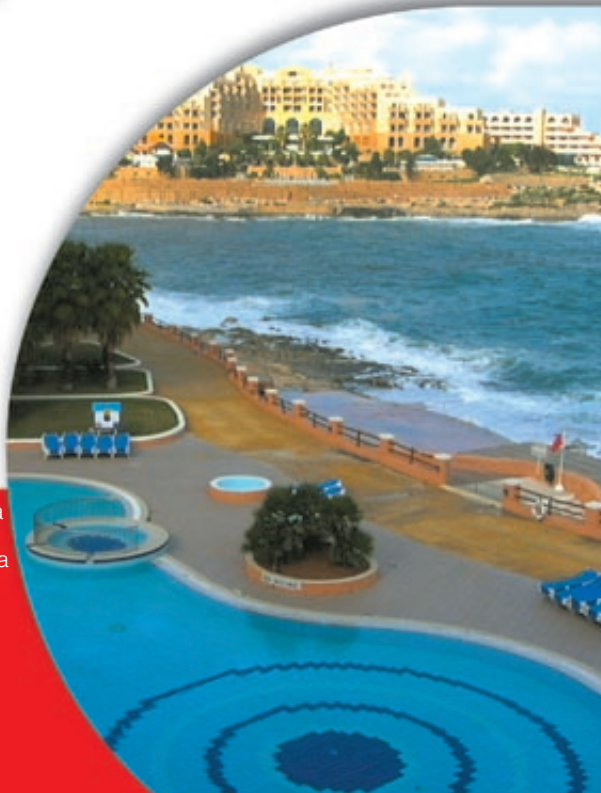
1400 tygodniowa wycieczka zagraniczna