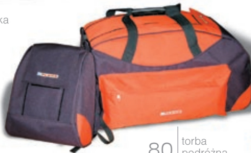
80 torba podróżna