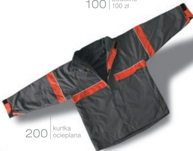
200 kurtka ocieplana