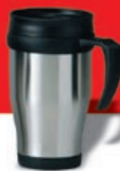
40 kubek termiczny