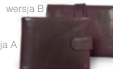
80 portfel skórzany - wiśniowy (wersja do wyboru)