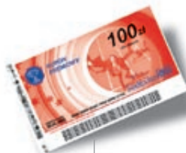
100 bon towarowy Sodexho 100 zł