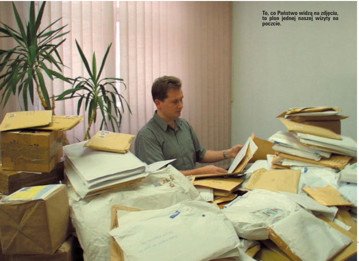
To, co Państwo widzą na zdjęciu, to plon jednej naszej wizyty na poczcie.

Wydamy go też wcześniej – już w lutym – aby z tymi zmianami zapoznać Was jak najszybciej, od samego początku trwania nowej edycji Purmo Experta.