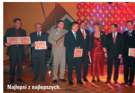
Najlepsi z najlepszych.

Był też jeszcze jeden ważny moment w trakcie balu i on też jest już tradycją: ogłoszenie rankingu najaktywniejszych w 2003 roku sprzedawców, instalatorów i projektantów w konkursie