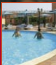
Experci od piramid str. 6