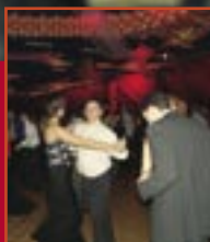
Doroczny bal str. 4