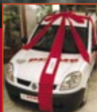
Wielka Loteria Purmo str. 3