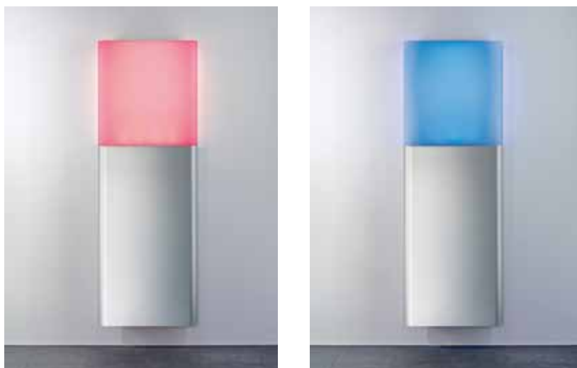
In der Premiumversion ist der Yarmy mit LED-Technologie ausgestattet. Über eine Fernbedienung können verschiedene Lichtszenen gewählt und eingestellt werden. Das Spektrum reicht von der Einstellung einer festen Farbe (rot, grün, blau, violett oder gelb leuchtend) über einen laufenden Farbwechsel (entweder „kühle“ Farben für den Sommer oder „warme“ Farben für den Winter) bis zum Lagerfeuerteffekt

Beide Größen bietet Purmo in zwei Beleuchtungs-Varianten: Die Basisversion spendet ein dimmbares einfarbiges Licht. Die Premium-Version ist mit LED-Technologie ausgestattet und liefert mehrfarbiges Licht, mit wechselnder Farbfolge oder freier Farbwahl, alles bequem über die mitgelieferte Fernbedienung einstellbar.