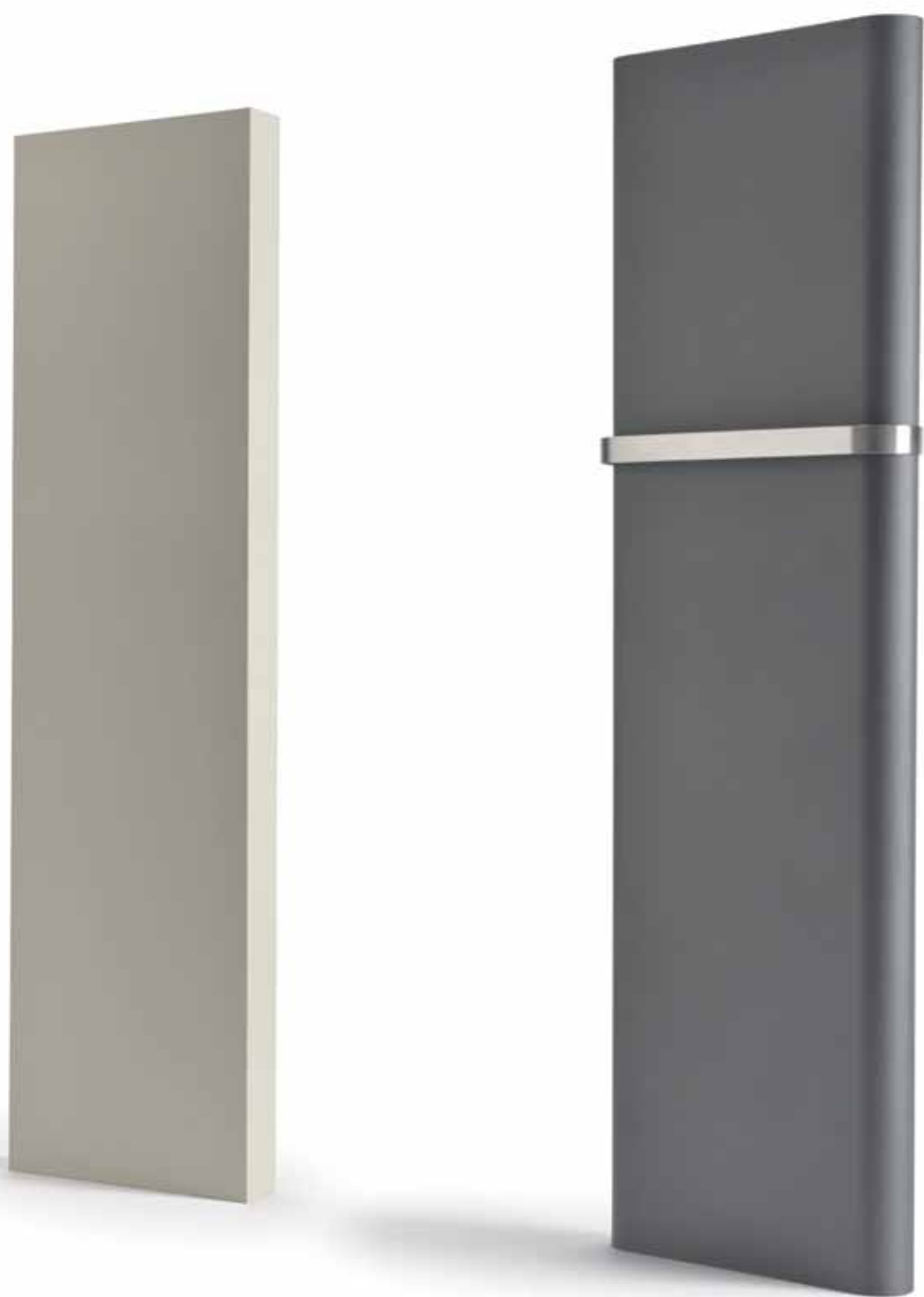
Handtuchhalter Edelstahl (optional)