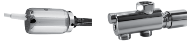
E03 - 300/600