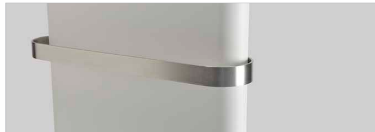
Håndklædeholderen i rustfrit stål er praktisk og giver radiatoren en ekstra elegance.

Når du vælger Tinos eller Paros gør du interiørdesigneren glad. Det er minimalisme med stort "M", og designet forstyrrer ikke de andre designelementer i boligen. Atmosfæren i et badeværelse skabes ofte af bløde, naturlige former - former der udstråler naturens ro og giver en følelse af velvære. De rene geometriske linjer i Tinos' design har deres helt unikke designsprog, og de smukt afrundede former i Paros passer perfekt til designsproget i moderne badeværelser. De bløde, sensuelle kurver giver det lille ekstra til dit badeværelse, og samtidig en behagelig varme og komfort.