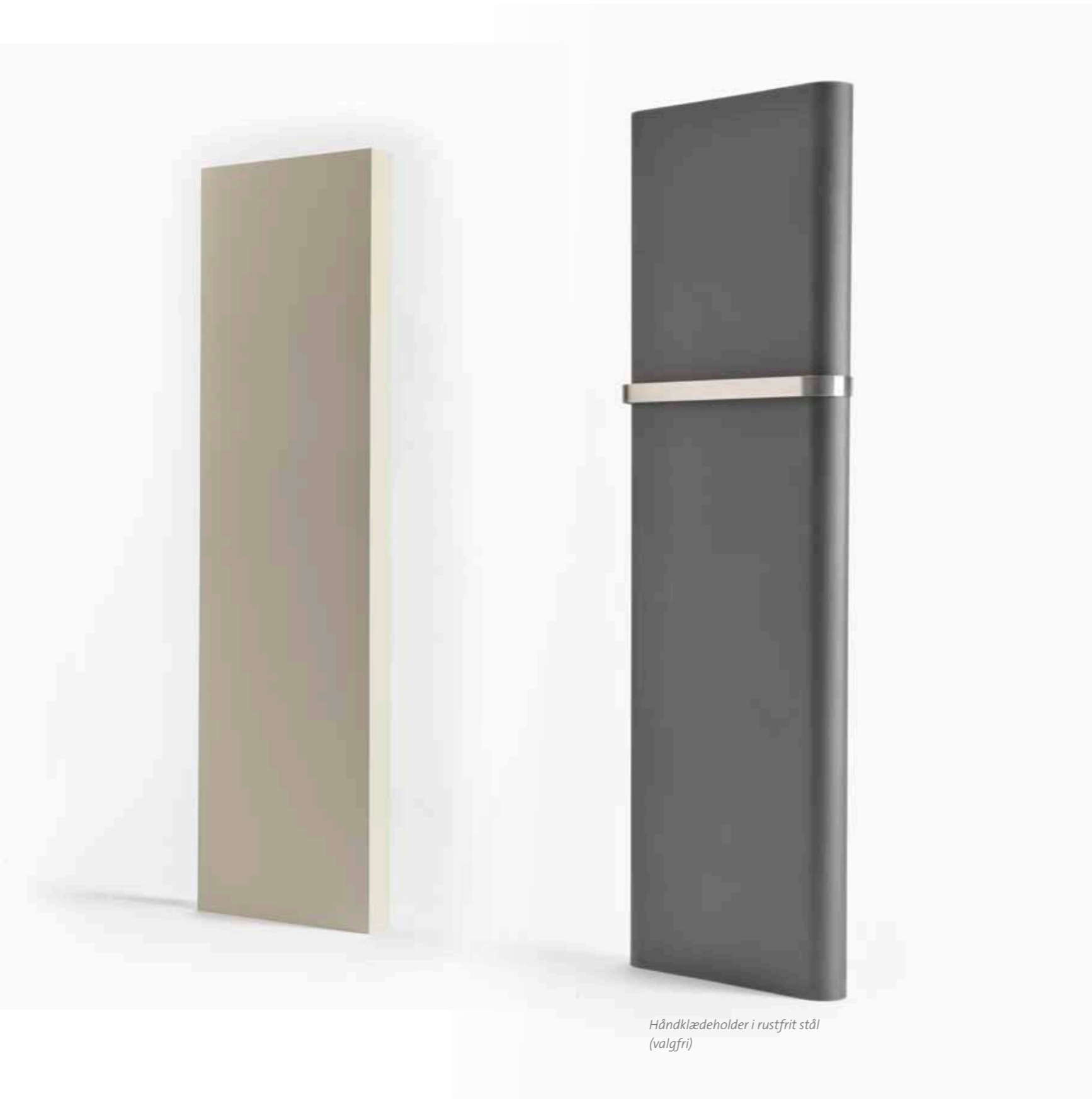
Håndklædeholder i rustfrit stål (valgfri)