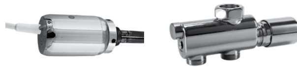
E03 - 300/600